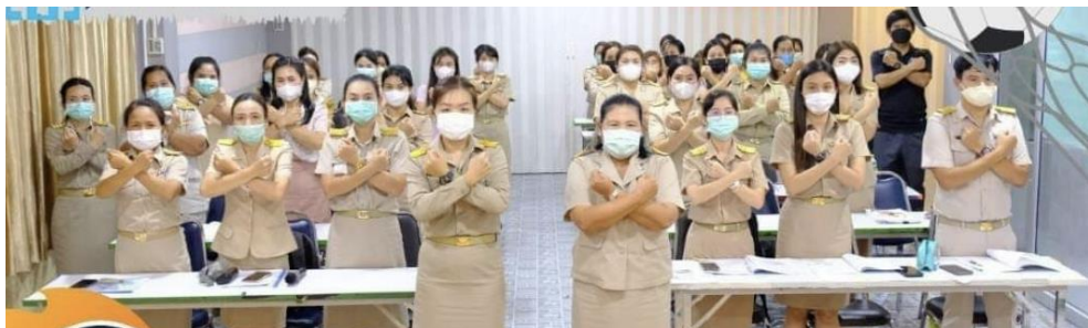
แสดงสัญลักษณ์ในการต่อต้านการทุจริตทุกรูปแบบ