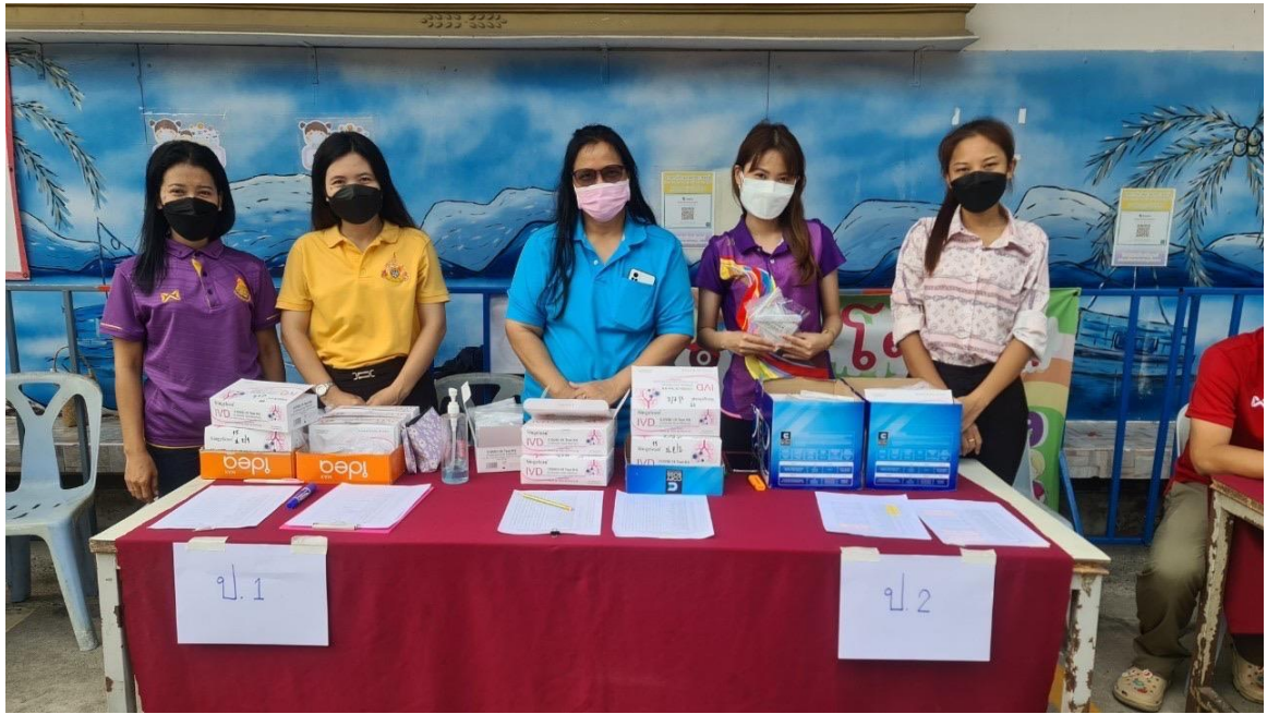
แจกชุดตรวจ ATK ให้กับผู้ปกครอง